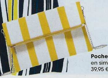
Pochette pliable en similicuir, 39,95 €, Benetton.