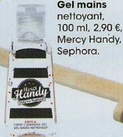
Gel mains nettoyant, 100 ml, 2,90 €, Mercy Handy, Sephora.