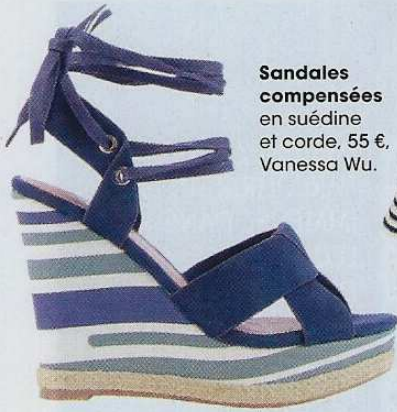
Sandales compensées en suédine et corde, 55 €, Vanessa Wu.