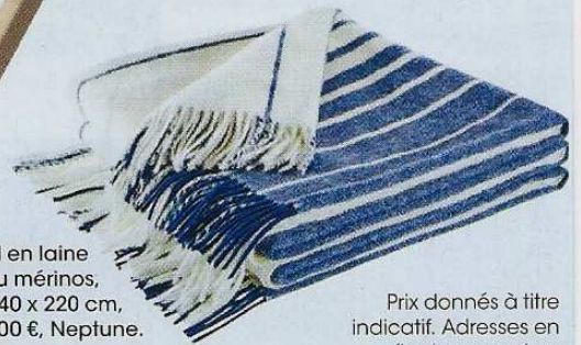
Prix donnés à titre indicatif. Adresses en fin de magazine.