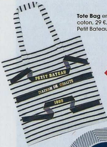
Tote Bag en coton, 29 €, Petit Bateau.