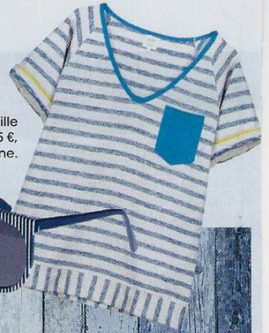
Sweat en maille et denim, 95 €, Blune.