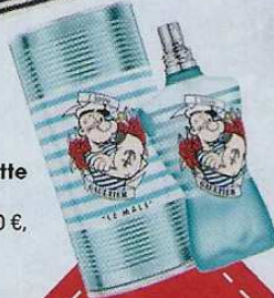
Eau de toilette « Le mâle », 125 ml, 72,50 €, Jean-Paul Gaultier, Nocibé.