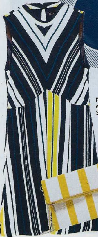
Robe en polyester, 39,95 €, Zara.