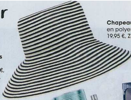
Chapeau en polyester, 19,95 €, Zara.